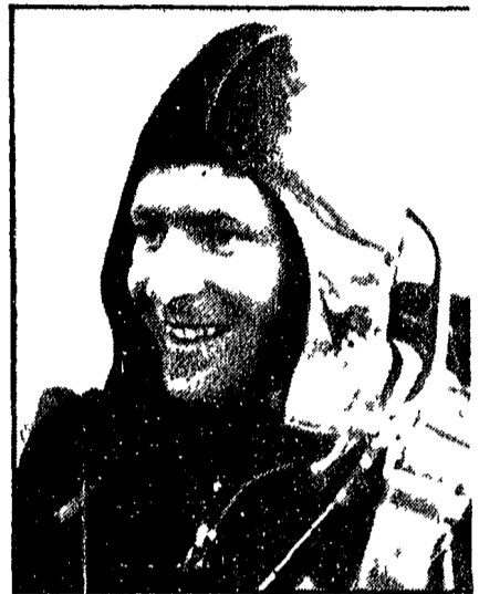
CITTA' DEL MESSICO, 25