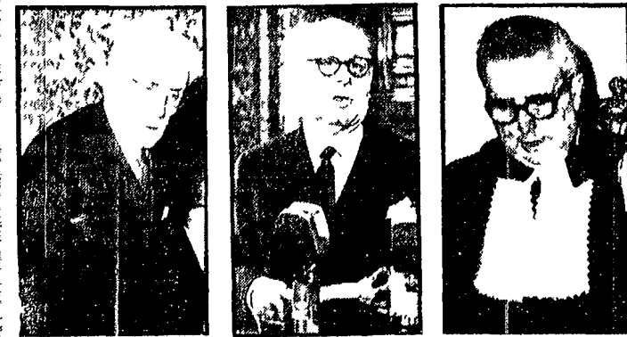
Questo pomeriggio a ore 16,30 in palazzo degli Uffizi si inaugura il corso di lezioni promosso dall'Unione provinciale di Firenze e il ventunesimo anniversario della Costituzione...