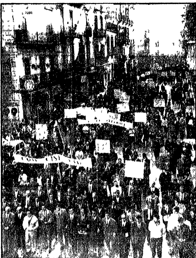
SALERNO - Un momento dell'imponente manifestazione

« la vertenza diventa subito più acuta più difficile » Potenza delle parole sa bene il caso di ieri Per cui 24 Ore volendo andare a fondo si chiede « Chi è e che cosa vuole questo potere operaio? » Insomma il potere operaio è presente e si manifesta in termini comprensibili Ma nessuno si presenta neanche quegli operai e quei studenti che hanno sposato la contestazione? E allora cosa fanno i sindacati? Non si accorgono che queste forme di contestazione erano sovente terreno fertile nelle loro richieste? Non si lasceranno mica « scuotere di potere » tanto più che l'Assolombarda impotenza delle parole? - è lavoratori acchi - la dialettica sindacale possa esprimere quel che si fa di potere e di potere padronale. Elio Fossa