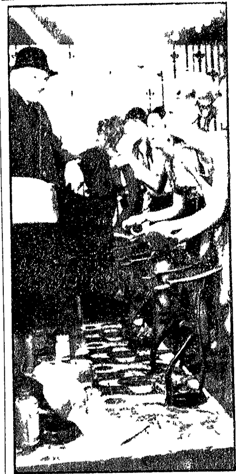
NEWARK (USA) - Gli affari andavano maluccio così il lucido scarpe della stazione di Newark si è organizzato. Ingrandito la bottega ed ha assunto sei belle ragazze in minigonna come « sciusciù ». Adesso le cosche, economicamente parlando, marciavano, nessuno gira più a Newark, con le scarpe sporche.

Clamorosa catena di errori degli investigatori nel giallo Delon