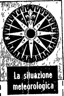
La situazione meteorologica

La situazione meteorologica è in un momento di grande incertezza. Nel sud della vasta regione di cui si parla qui sembra che si stia formando un sistema di bassa pressione che si muove verso il centro della penisola italiana. In Sicilia e in Sardegna si prevedono piogge e venti forti. In Sardegna si prevedono piogge e venti forti. In Sardegna si prevedono piogge e venti forti.