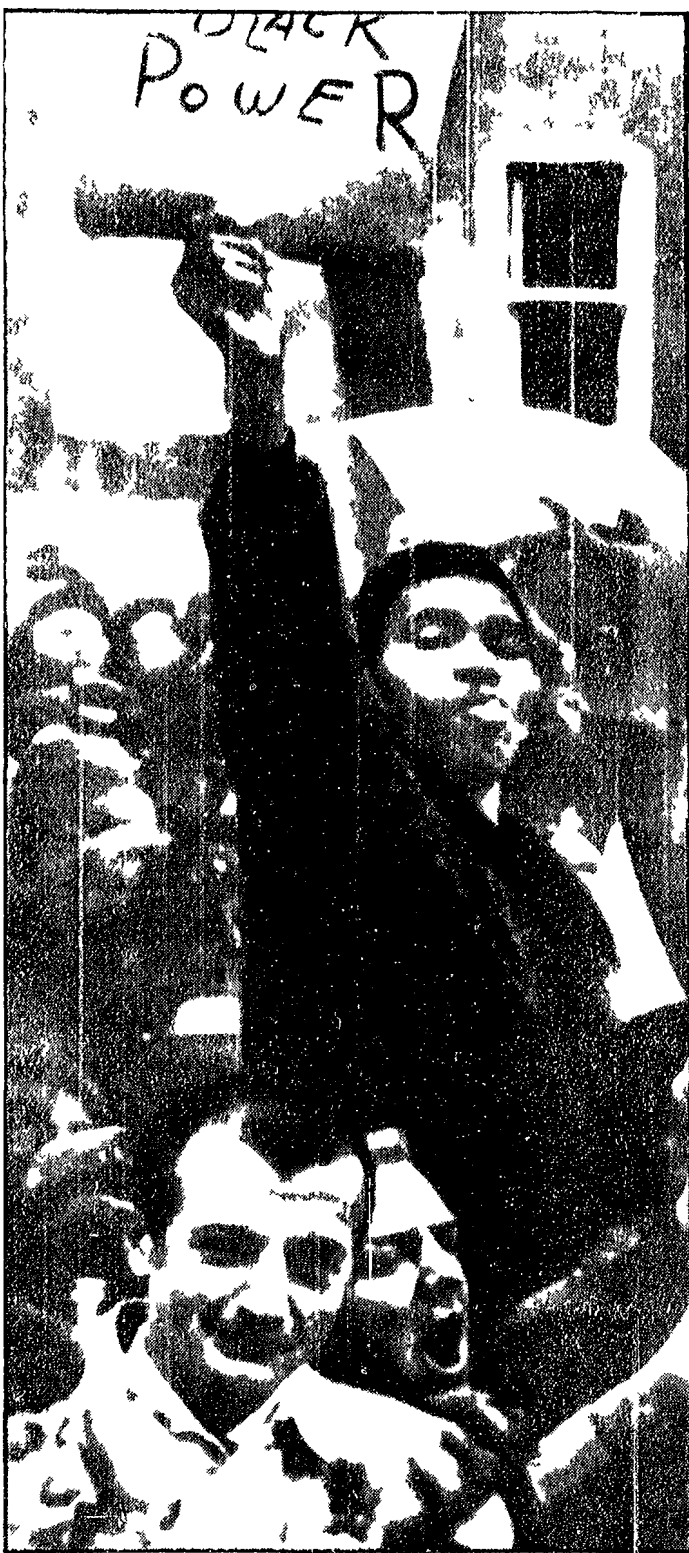
HANNIBAL — « Controdemonstranti » negri interrompono un comizio del candidato fascista, George Wallace. Sul cartello è scritto « Polvere negro », la parola d'ordine la cui realizzazione sta diventando il banco di prova del conflitto razziale.