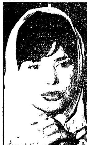
Harriet Andersson in « Come in uno specchio » di Bergman