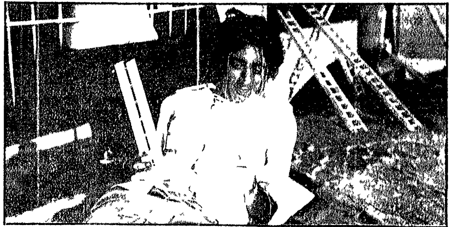
Una scena del « Viaggi di Gulliver »