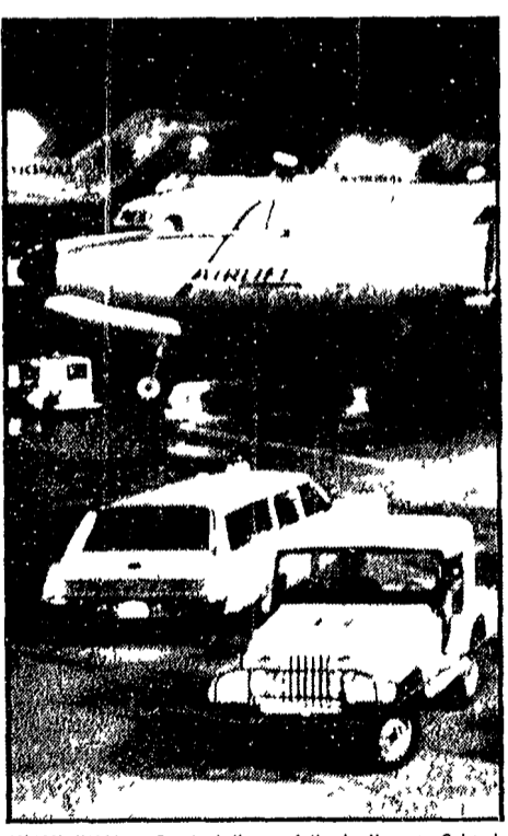
MIAMI (USA) - Questo è l'aereo fatto dirottare su Cuba da un negro membro del movimento « Black Nationalist » (il DC-7 dell'Alfite) - qui fotografato sulla pista di Miami qualche minuto prima del suo decollo - era diretto a New Orleans con 65 passeggeri a bordo

SAIGON 5 I capi del regime sudvietnamita hanno organizzato oggi una dimostrazione per contestare con forza la decisione di Johnson di restituire gli altissimi aerei sul Nord Vietnam.