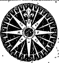
La situazione meteorologica

precipitare la famiglia cristiana nel disordine. I vescovi di Francia sono a rivisti a queste conclusioni dopo avere condotto nelle 11 diocesi diocesane una inchiesta approfondita tra i fedeli e i sacerdoti e gli specialisti di problemi matrimoniali.