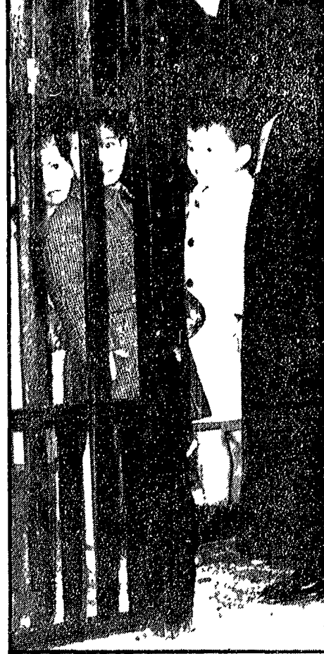
PRATO - Alcuni dei piccoli ricoverati nell'orfanotrofo dei Celestini