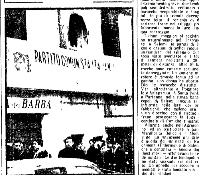
PALERMO - L'ingresso della sezione incendiaria.

Palermo. Il vento e le piogge che per la mancanza di elementi e modestissime opere di impiantamento hanno provocato lo straripamento del torrente Xilite si sono abbattute con l'effetto di un uragano sulla città sconvolta dal terremoto di gennaio. Secondo i primi dati che con difficoltà affluiscono dalle province di Trapani e Agrigento e dall'entroterra palermitano il quadro della situazione appare estremamente grave e due tendopoli semidistrutte, centinaia di baracche superottimate e inagibili in più di tremila persone sono state sventrate e i letti di lamiera protetti a 20 metri di distanza, oltre 60 baracche sono rimaste seriamente danneggiate. Un giovane minatore è rimasto ferito ad una gamba, una donna ha abortito. Dieci le baracche distrutte a Vico Altrettante a Poggioreale e Salaparuta a Santa Ninfa a Partanna la stessa baracca sono state sventrate e i letti infittiti nelle bare dei prefabbricati che cedono ora a vista d'occhio con il rischio di franare provocando la fuga di centinaia di famiglie sinistrate. Allarme anche nell'Agrigento e in particolare a Santa Margherita Belice e a Montebello. La situazione più grave è quella dei sinistrati di Roccamena (Palermo) e di Salaparuta che continuano - ancora dopo dieci mesi - a sfollare le tende di fortuna. Le due tendopoli sono state sventrate e un appello per soccorsi immediati è stato lanciato via a due dei sindaci.