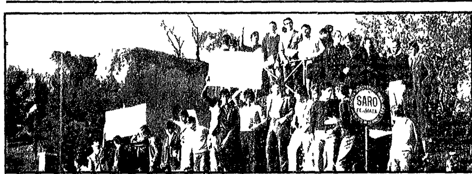
Studenti medi di Roma in assemblea sul piazzale del Colosseo

Gli studenti medi bolognesi hanno continuato le loro manifestazioni contro i tagli alla spesa e le repressioni poliziesche. A Bologna, gli studenti hanno organizzato una serrata in un istituto tecnico industriale.