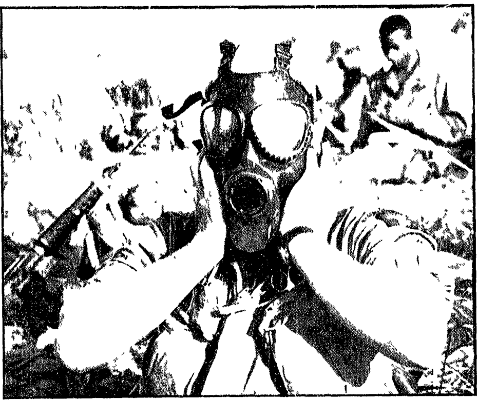
PHU LOC (Sud Vietnam) - Una compagnia di marines ha scatenato un attacco con i gas contro una località a pochi chilometri da Hue. Nella foto un marine si toglie la maschera anti-gas usata nell'attacco

«minaccia di proseguire le conversazioni con i vietnamiti del nord (e quindi di continuare ad ignorare la presenza a Parigi di una delegazione del Fronte) ad essere perfettamente alle prese con il governo di Saigon la cui sola preoccupazione è di impedire che il Fronte partecipi ai negoziati».