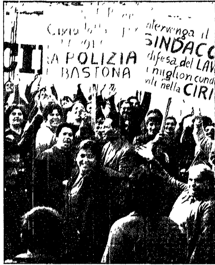
CASTELLAMMARE DI STABIA. Un momento della manifestazione di protesta delle dipendenti della Cirio