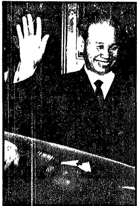
Xuan Thuy che dirige la delegazione della RDV a Parigi

Cao Ky alla testa di numerose delegazioni, incaricate, anziché della trattativa, di una controffensiva propagandistica - Xuan Thuy: la trattativa esige una delegazione del FNL pienamente autonoma