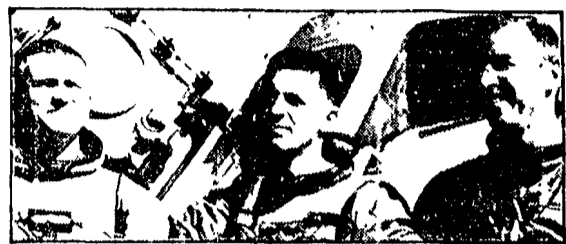
William Anders, James Lovell e Frank Borman, dell'Apollo 8: il loro viaggio verso la Luna potrà essere seguito in TV il 21 dicembre.