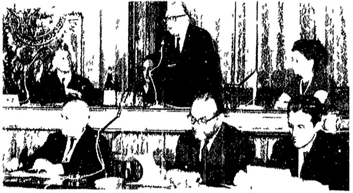
ieri sono proseguiti i lavori dell'incontro sul patrimonio artistico promosso dal gruppo indipendente di sinistra del Senato. Alle riunioni di Argan, Bianchi Bandinelli e Samonà ha fatto seguito un ampio dibattito che si è concluso nella giornata di oggi con l'approvazione di una mozione finale. NELLA FOTO un momento dell'incontro nella Sala di Luca Giordano