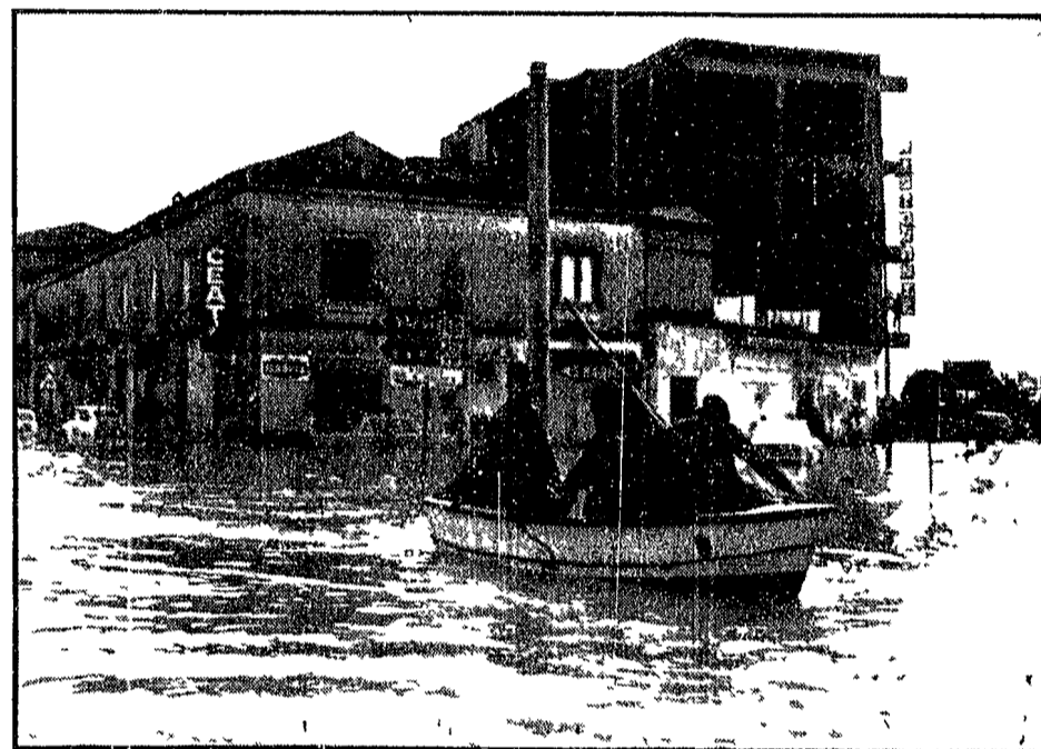
CAPUA — Una scialuppa dei vigili del fuoco reca soccorso agli abitanti tra le strade completamente allagate (Telefoto A 1)