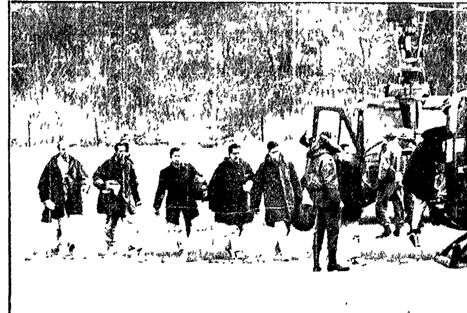
PANMUNJOM — Gli 82 membri dell'equipaggio della nave spia americana «Pueblo» liberati ieri a Panmunjom dopo undici mesi dalla cattura della nave da parte delle autorità nordcoreane. Vengono fatti salire su elicotteri per essere portati presso Seul, dove saranno sottoposti a una serie di controlli sanitari.

Bucher ha aggiunto in questa curiosa conferenza stampa tenuta dopo la liberazione di essere stato tenuto in costante isolamento per tutti gli undici mesi di detenzione. E questo ci ispirava tanto per Bucher è falso quanto per i coreani è vero. Bucher aveva stare e alla porta non aveva tollerato o lucchelli era con un altro ufficiale. Stava per recarsi a un'aula di essere stato maltrattato e bastonato da detto di essere stato tenuto in costante isolamento per tutti gli undici mesi di detenzione. E questo ci ispirava tanto per Bucher è falso quanto per i coreani è vero.