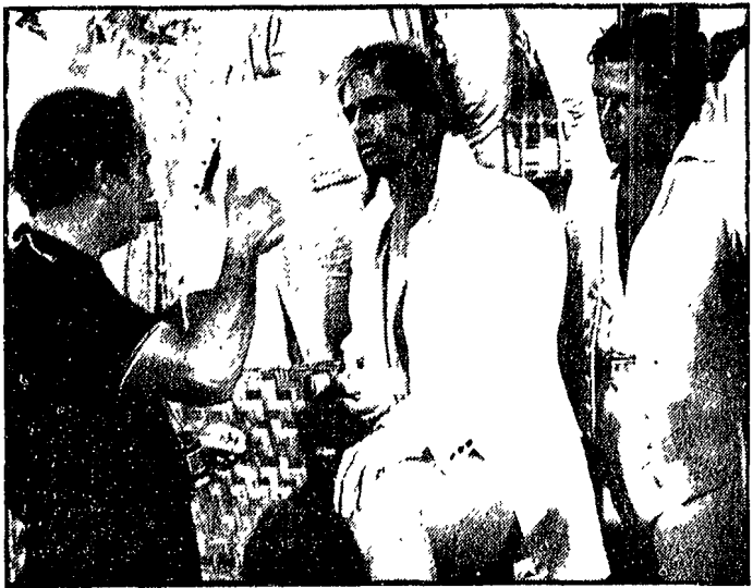
CARTAGENA — Il regista Gillo Pontecorvo spiega a Marlon Brando e a Renato Salvatori, truccato da mulatto, una scena del film « Quemada » le cui riprese sono in corso, da alcune settimane, in Colombia.