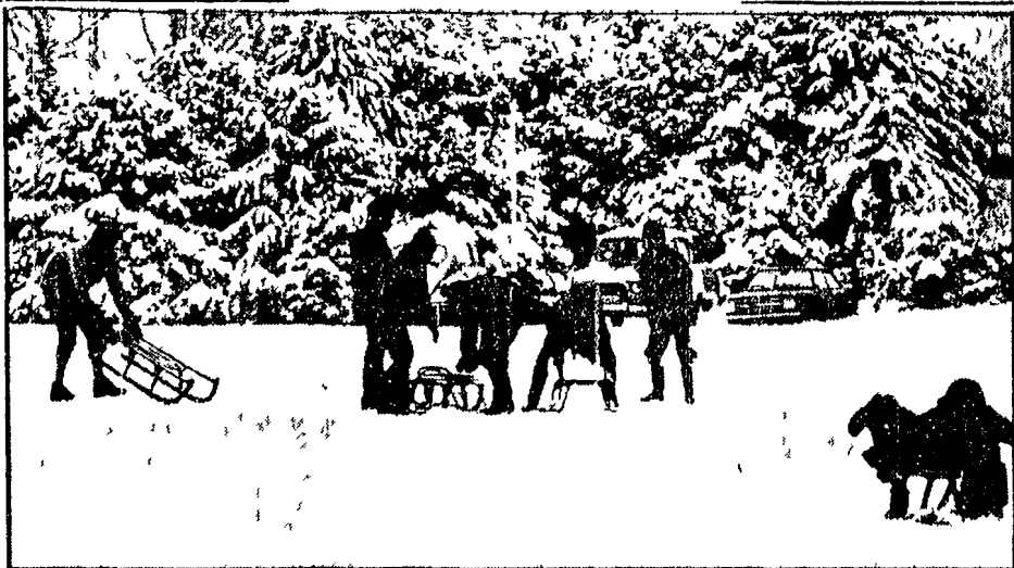
Un'ondata di gelo si è registrata in tutta l'Europa. Nel parco di Laeken a Bruxelles numerosi bambini si divertono con slitta sulla spessa coltre di ghiaccio.