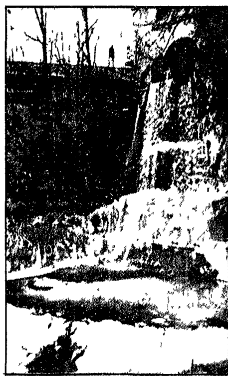
Una visione siberiana ripresa alla periferia di Bologna.

L'ondata di freddo che si è abbattuta su tutta l'Europa si è manifestata in Svizzera con temperature polari e abbondanti nevicate. Numerosi incidenti stradali sono stati provocati dal ghiaccio che ricopre molte strade. Freddo polare anche in tutta la Francia dove la scorsa notte il termometro è sceso sotto zero con punte di 17 a Grenoble.