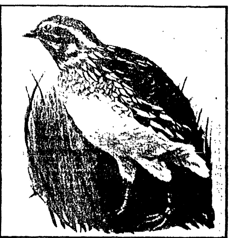
LA SPIGOLA vive solitaria nei campi e nelle disse erbose, sempre nascosta tra la vegetazione. Il suo volo è lento e breve.

Legge 799 del 2-8-1967 articolo 1: «L'esercizio della uccellazione e consentito fino al 31 marzo 1969».