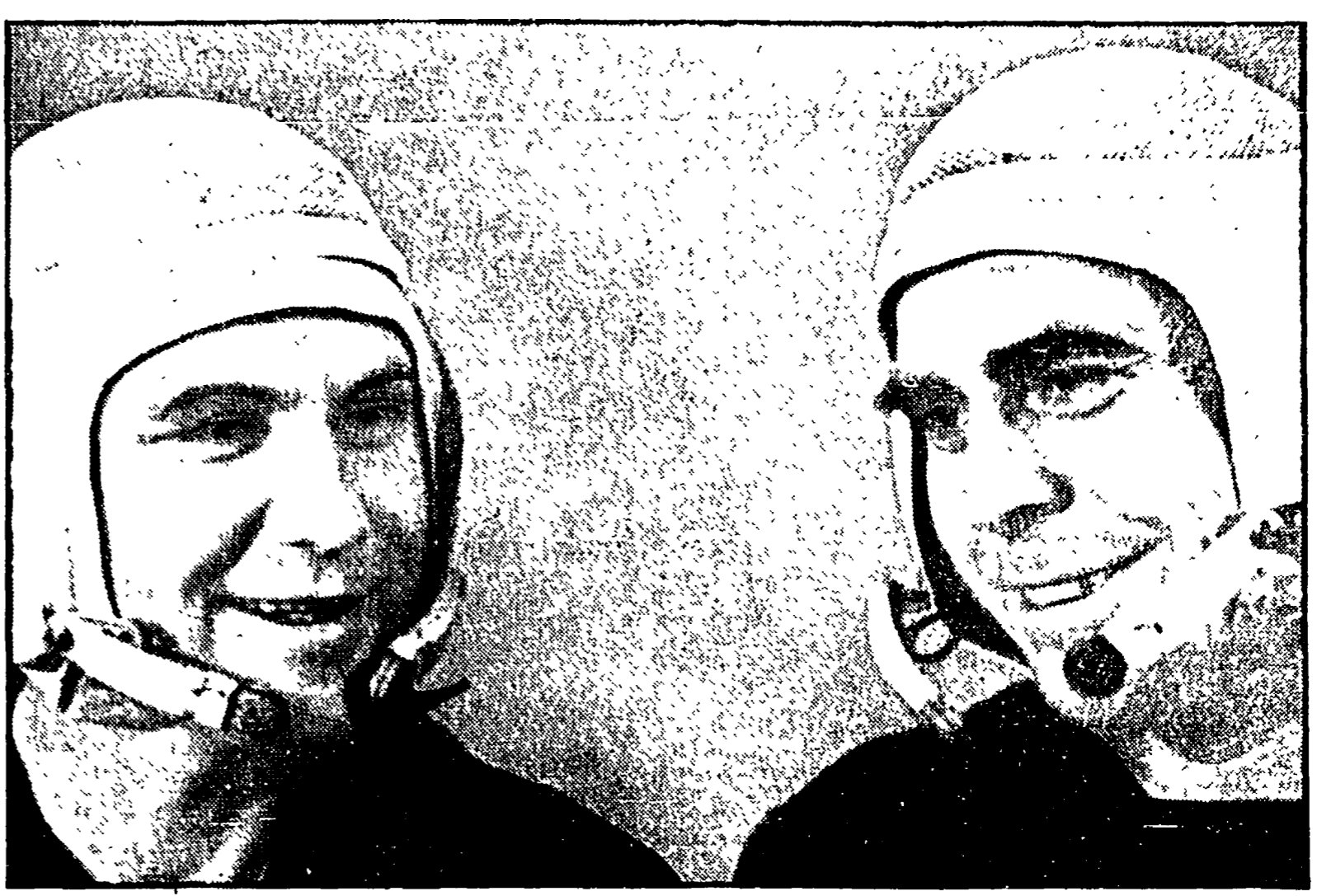
Nella foto a destra: i cosmonauti Sciatlov (sinistra) e Beregovoi durante un intervallo del loro lavoro a Baikonur.