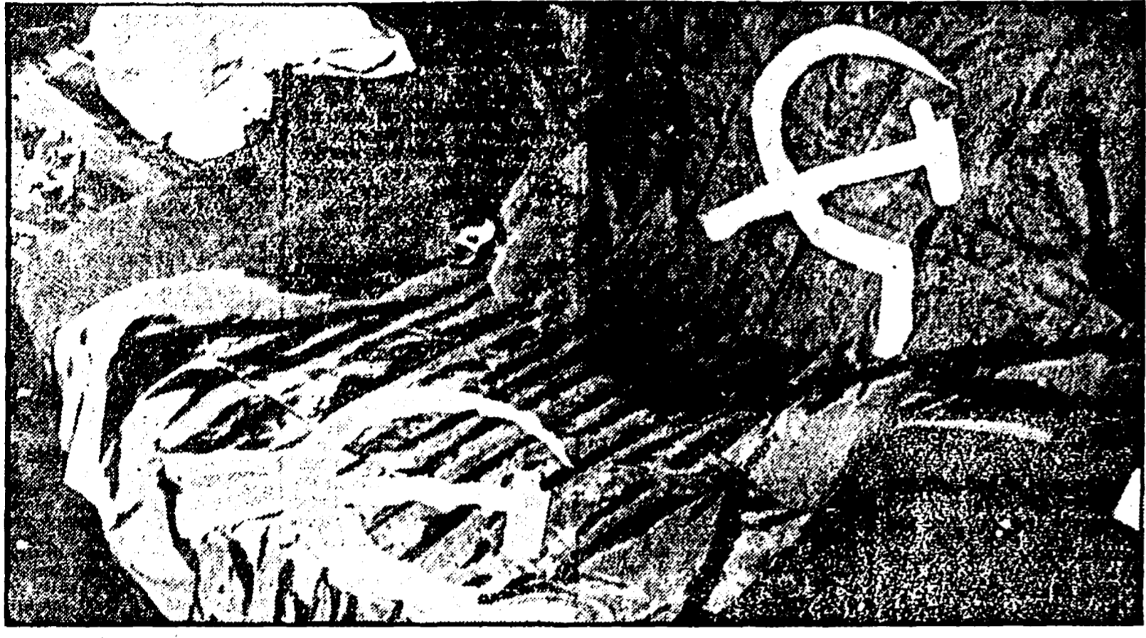
BARCELONA — Due immagini della forte manifestazione degli universitari contro il regime franchista. Nella foto in alto: lo studio del rettore il busto del dilatore Franco, rovesciato a terra, poco prima di essere scaraventato dagli studenti nella strada; nella foto in basso, le due bandiere rosse che gli universitari di Barcellona hanno esposto dal balcone del rettore

Si allarga in Spagna la lotta contro la dittatura