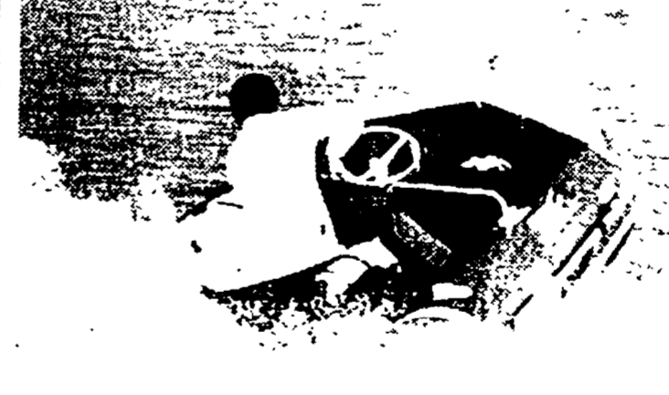
Un motore fuoribordo Carniti da 55 HP montato sul «Laros 40 Sport» della Pirelli...