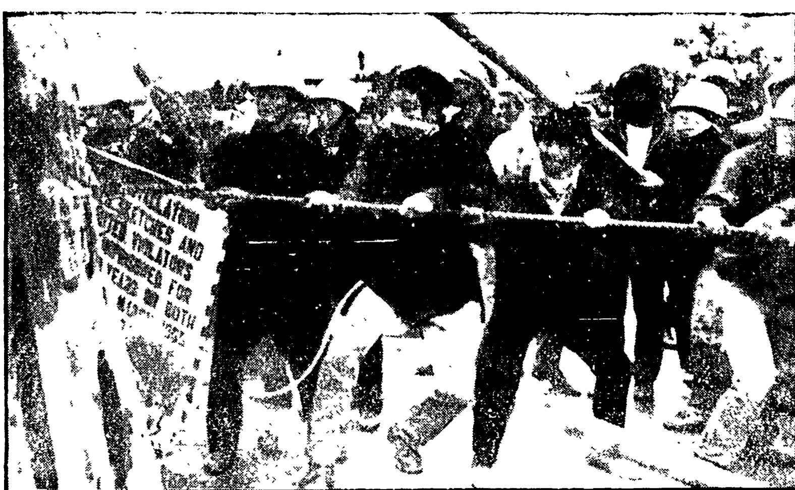
OKINAWA - Oltre cinquantamila persone hanno preso parte ieri a una poderosa serie di manifestazioni contro la presenza nella isola, nella base di Kadena, dei bombardieri strategici USA B-52...