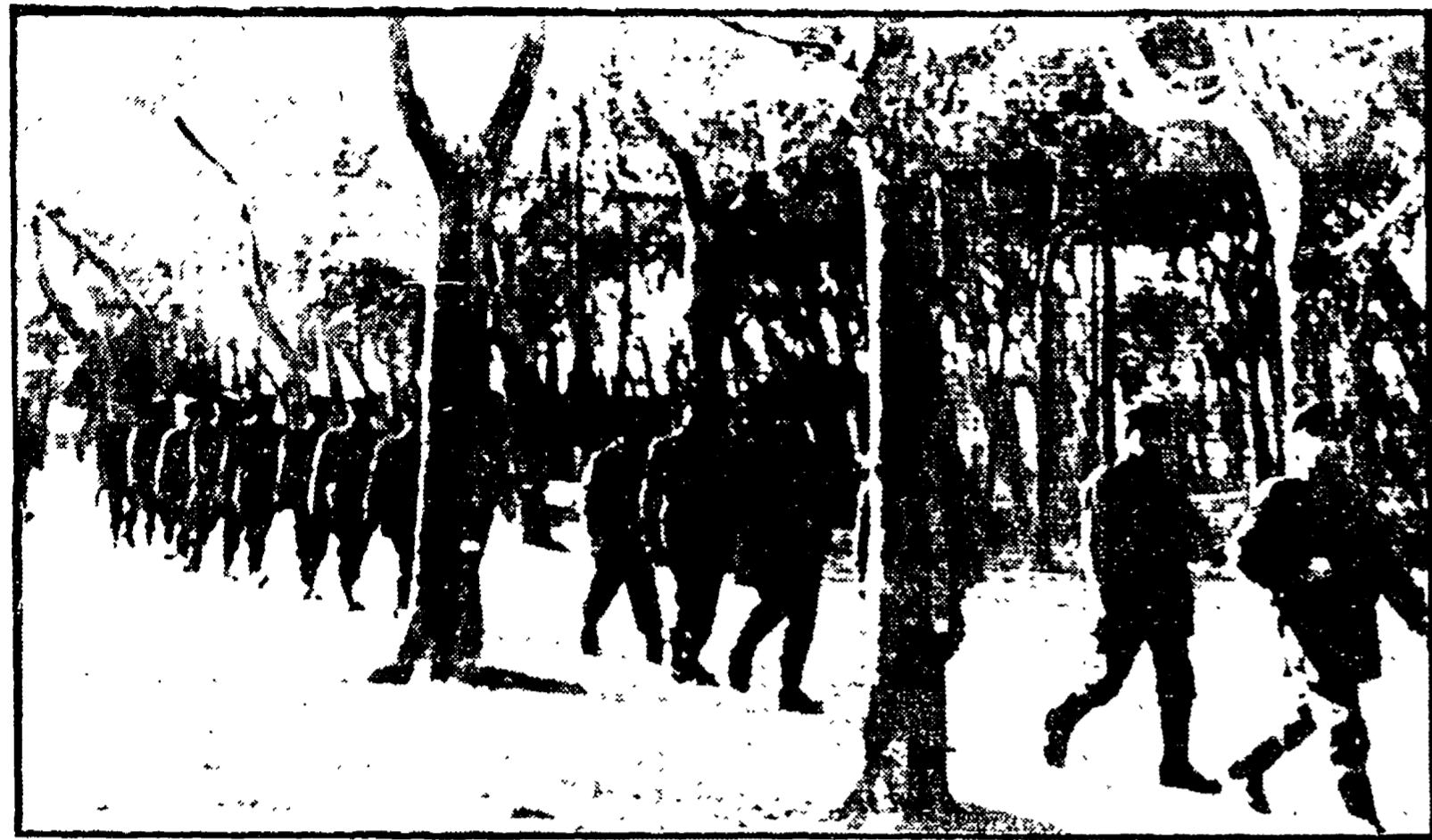
VIAREGGIO - Un rastrellamento nella pineta