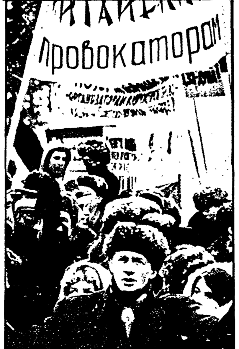
MOSCA - Un momento della manifestazione di ieri nei pressi dell'ambasciata cinese