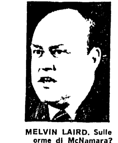
MELVIN LAIRD. Sulle orme di McNamara?