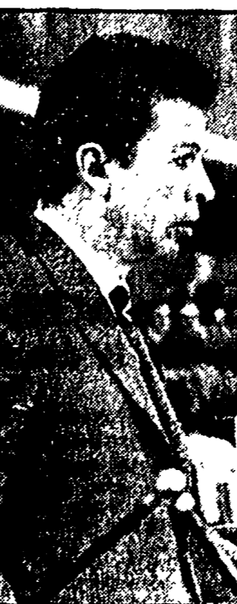
parla Enrico Berlinguer vice segretario del PCI ORGANIZZATE L'ASCOLTO!

Tribuna politica giovedì (ore 22) alla TV