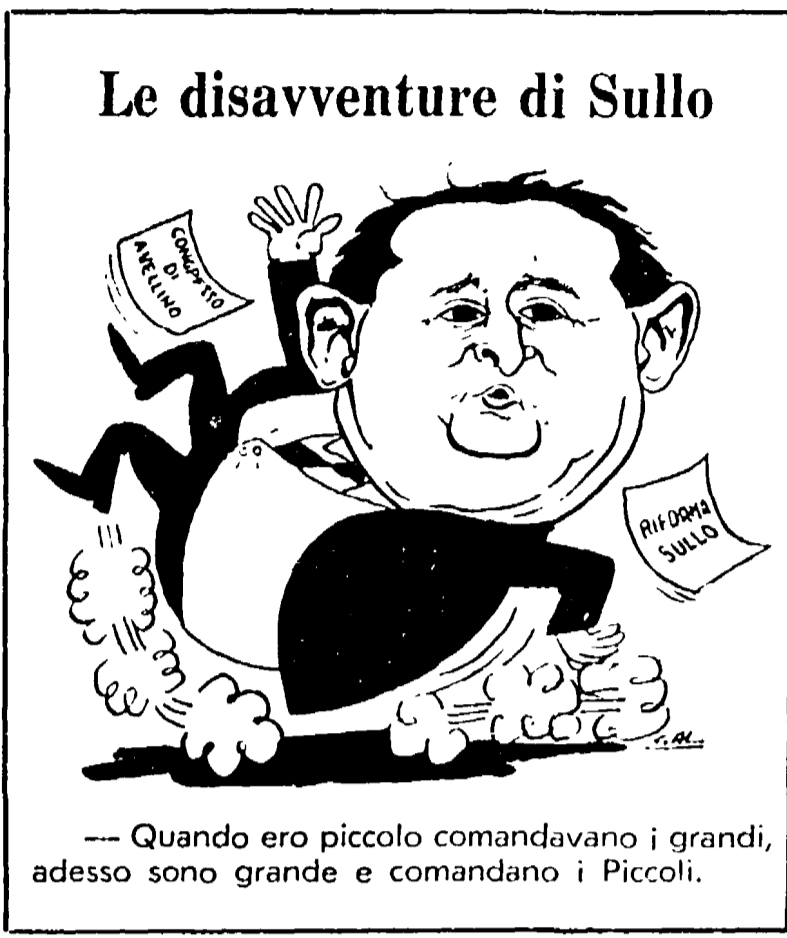
Quando ero piccolo comandavano i grandi, adesso sono grande e comandano i Piccoli.

mancati spunti interessanti: una parte notevole dei lavori è stata dedicata al rapporto con i comunisti; e alle posizioni che si riallacciano alla tradizione anticomunista dei tanassiani ha fatto riscontro un più articolato ventaglio di atteggiamenti da parte delle altre forze.