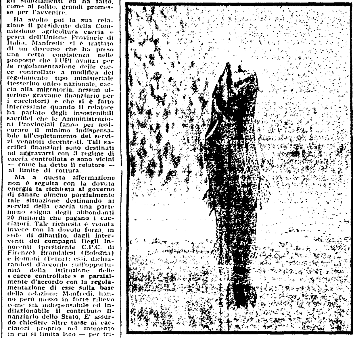
Ami per la pesca alla trota: un argommo che anima le dispute tra pescatori. Oggi cercheremo di dire la nostra, senza darci la patente di infallibili. Gli ami a curva lunga dovrebbero, secondo noi, essere scartati, questi ami sono ottimi per l'innescò di esche vegetali, ma non per l'innescò di esche che devono essere presentate al pesce in posizione naturale, cioè erette e, tipo cavallette, lombrichi e tutti gli insetti in genere. Quindi i ami dritti e ami reversibili sono da preferire i secondi che permettono, appunto, un migliore abbozzo anche nel caso che avvenga di piatto. E tra i ami a gambo corto e ami a gambo lungo è preferibile usare i secondi perché la loro lunghezza facilita, agendo come una leva, la penetrazione nella bocca della trota.

Dopo il convegno sulle «cacce controllate»