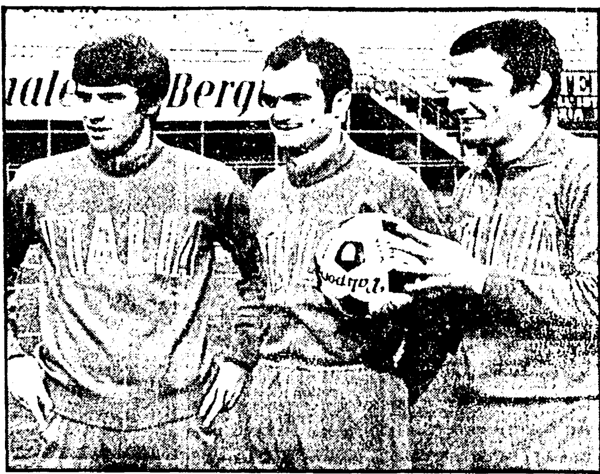
PRATI, MAZZOLA e RIVA il trio di centro dell'attacco azzurro.

NAZIONALE. Zoff (Cudicini); Burgnich, Facchetti; Bertini, Salvadori, Castano; Prati, Rivera, Mazzola, De Sisti, Riva. MISTA ATALANTA JUNIORES AZZURRI: Cudicini (Zoff); Majani, Poletti; Lodetti (Morosini), Zamboni, Martignoli (Pezzi); Moro (Muller), Jansson, Maraschi (Donina), Boninsegna, Doldi. ARBITRO: Valcareggi.