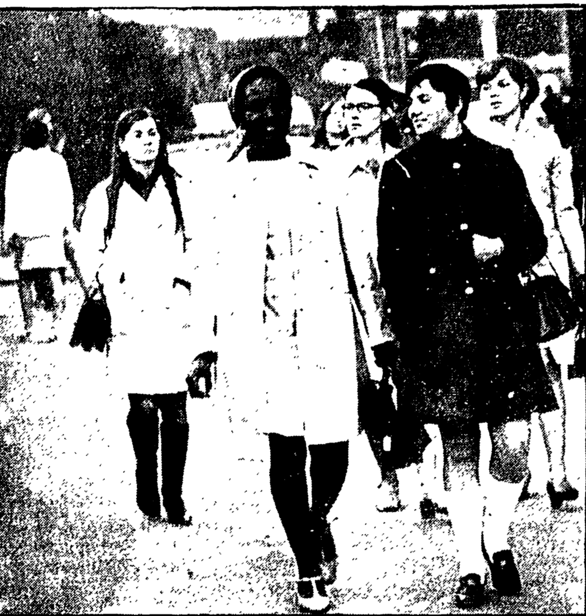
Turisti a frotte in queste giornate pasquali lungo le strade cittadine. Belle ragazze a sciami, tanti giovani, italiani e stranieri... I milanini si ammassano nelle piazze, mentre le mete tradizionali dei turisti, il centro storico e i musei, sono quasi vuoti...