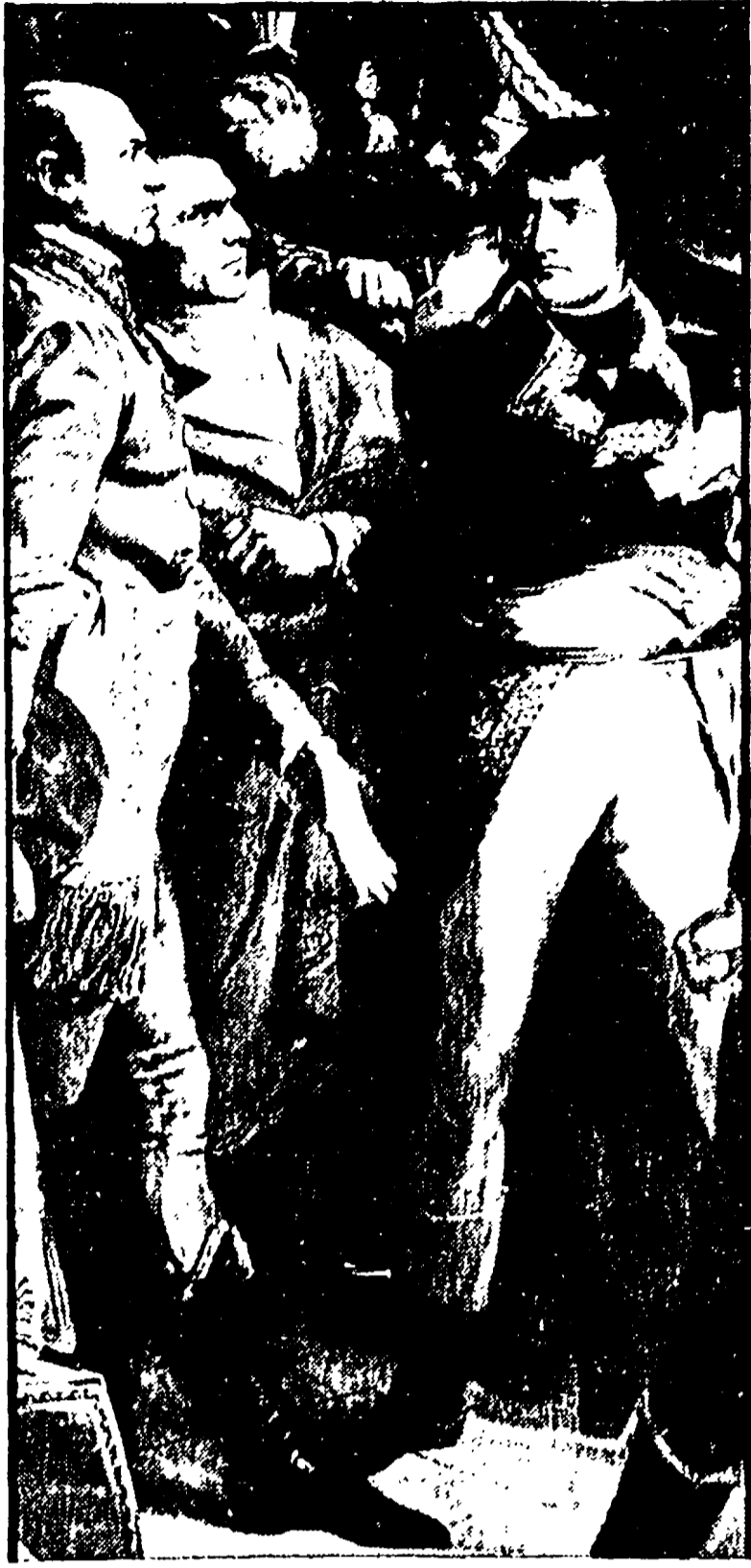
10 novembre 1799: il colpo di Stato in un dipinto di F. Bouchot

glottinati a che, sotto la direzione di Saint Just, scorticava le donne e ne concitava la pelle... Come mai, si domanda costui, nessuno ha mai pensato a costringere questa gente a risultare il maitre come si fa coi criminali di guerra?