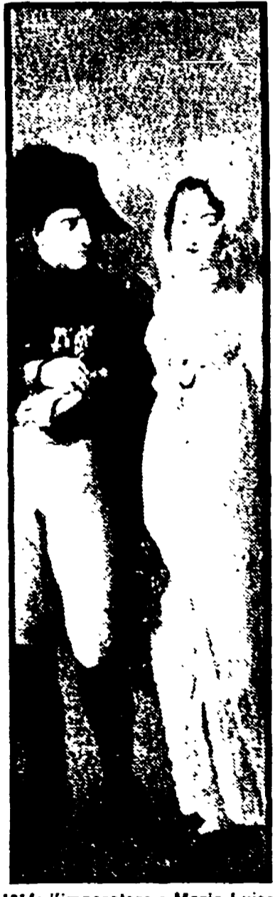
1814: l'imperatore e Maria Luisa