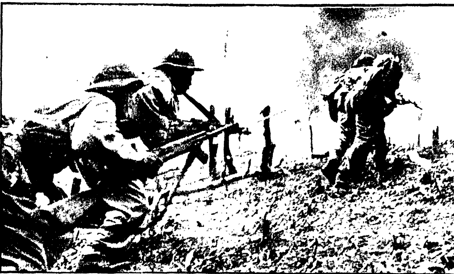
Partigiani del FNL durante un attacco

L'undicesima riunione della conferenza di Parigi per il Vietnam è stata aperta da un Vietnam con lancia di petardi e rullo di tamburo in onore del IX Congresso del partito a Hanoi.