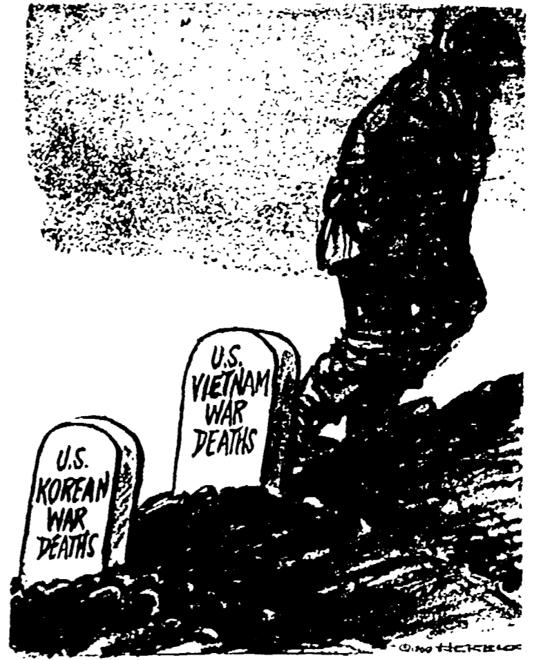
«QUOTA 1969» è il titolo di questa vignetta del New York Times. Le lapidi segnano i livelli delle perdite nelle guerre di Corea e del Vietnam.