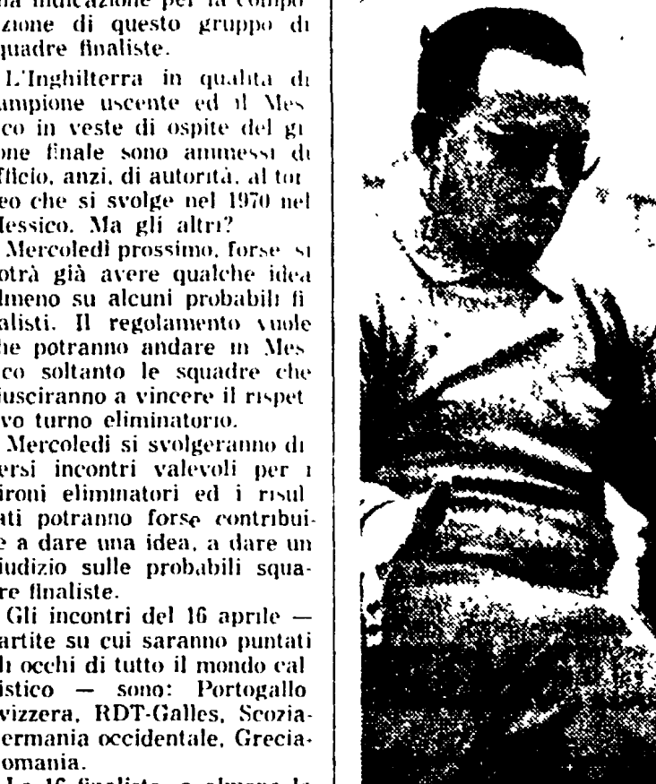
I tifosi protestano contro Fabbri

VACANZE LIETE BELLARIA - VILLA GIANELLA, Via Po, tel. 49.112. Vicinissima mare - rimodernata - cucina romagnola - Bassa 1600 - tutto compreso. CESENATICO - VALVERDE - FO - HOTEL APOLLONIO Il Cat. Nuovissima, moderna costruzione. Tutte le camere con servizi e doccia. RIMINI - S. GIULIANO - PENSIONE FABIANA - Via Rinaldi, 12, tel. 24.973 - Ambiente familiare - accogliente - vicinissimo mare - Giardino - parcheggio - Gestione Proprietario. Prezzi veramente vantaggiosi Prenotativi.