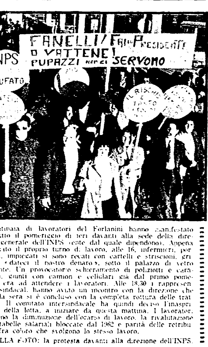
Centinaia di lavoratori del Forlanini hanno manifestato per tutto il pomeriggio di ieri davanti alla sede della direzione generale dell'Inps (vedi dal quale dipendono). Appena terminato il proprio turno di lavoro, alle 16, infermieri, portieri, impiegati si sono recati con cartelli e striscioni, gridando «datemi il nostro denaro», sotto il palazzo di vetro dell'Ente. Un provocatore e schieramento di poliziotti e carabinieri, giunti con camion e cellulari già dal primo pomeriggio era ad attendere i lavoratori. Alle 18,30 i rappresentanti sindacali hanno avuto un incontro con la direzione che a tarda sera si è concluso con la completa rottura delle trattative. Il comitato inter-sindacale ha quindi deciso l'inasprimento della lotta, a iniziare da questa mattina. I lavoratori chiedono la diminuzione dell'orario di lavoro, la riabilitazione delle tabelle salariali bloccate dal 1962 e parità delle retribuzioni fra coloro che svolgono lo stesso lavoro. NELLA FOTO: la protesta davanti alla direzione dell'INPS.

L'incontro con la direzione senza esito. Deciso l'inasprimento della lotta