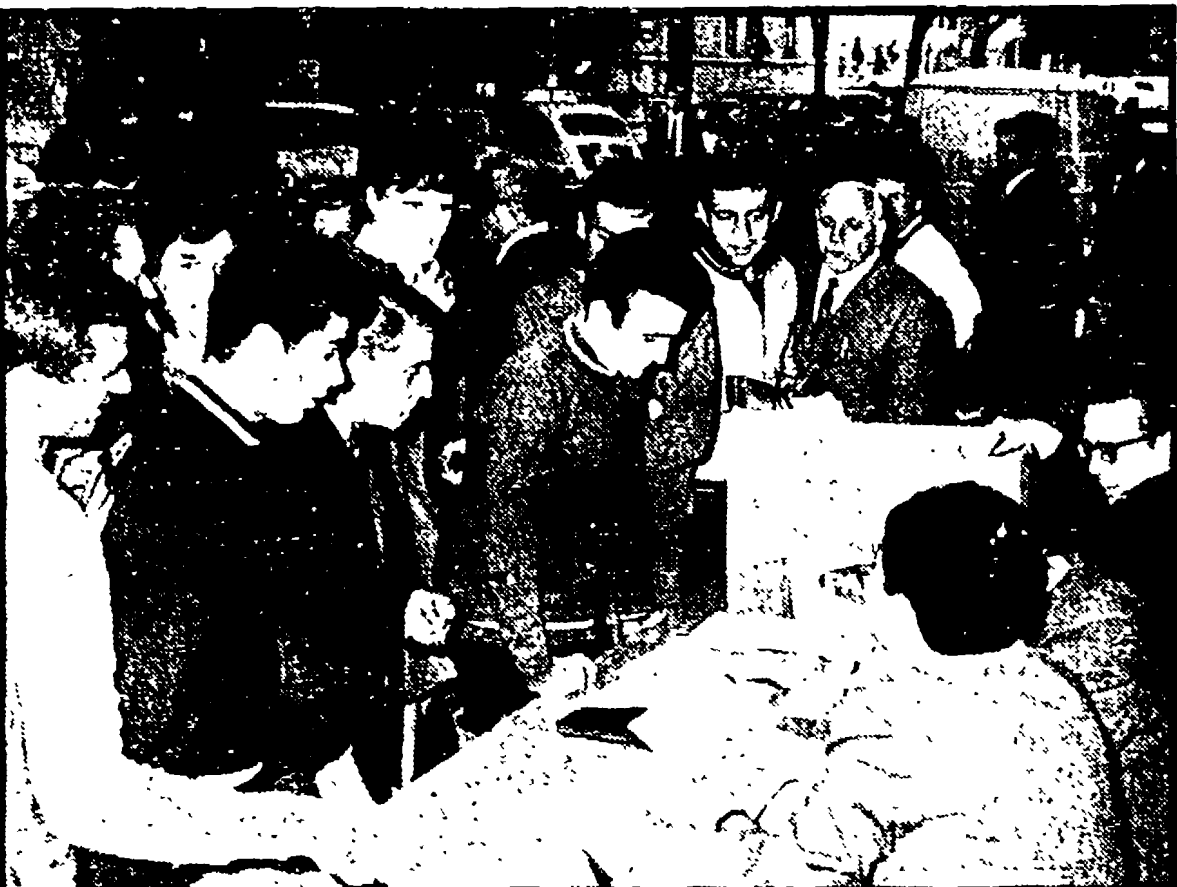
Due momenti della punzonatura davanti alla sede de «L'Unità».

Oltre 200 corridori al «via!» garantiscono in partenza il grande successo della nostra corsa. Contro l'agguerrito campo dei ragazzi di casa i corridori dell'URSS, della Bulgaria, della Cecoslovacchia e della Libia. La partenza sarà data dal compagno Antelli