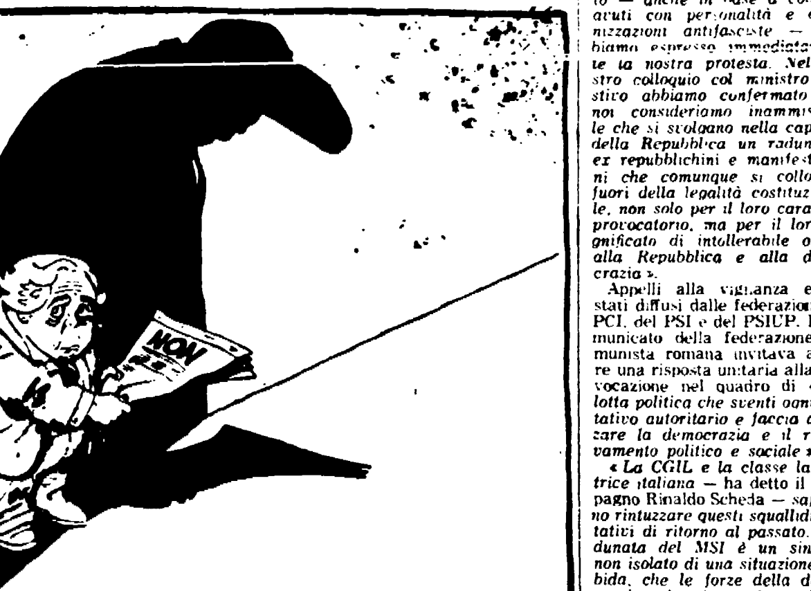
L'ombra di De Gaulle pesa su Wilson (dal «Daily Mail»)

Un leader della sinistra afferma: «Non cadremo nel tranello e continueremo a difendere i diritti sindacali»