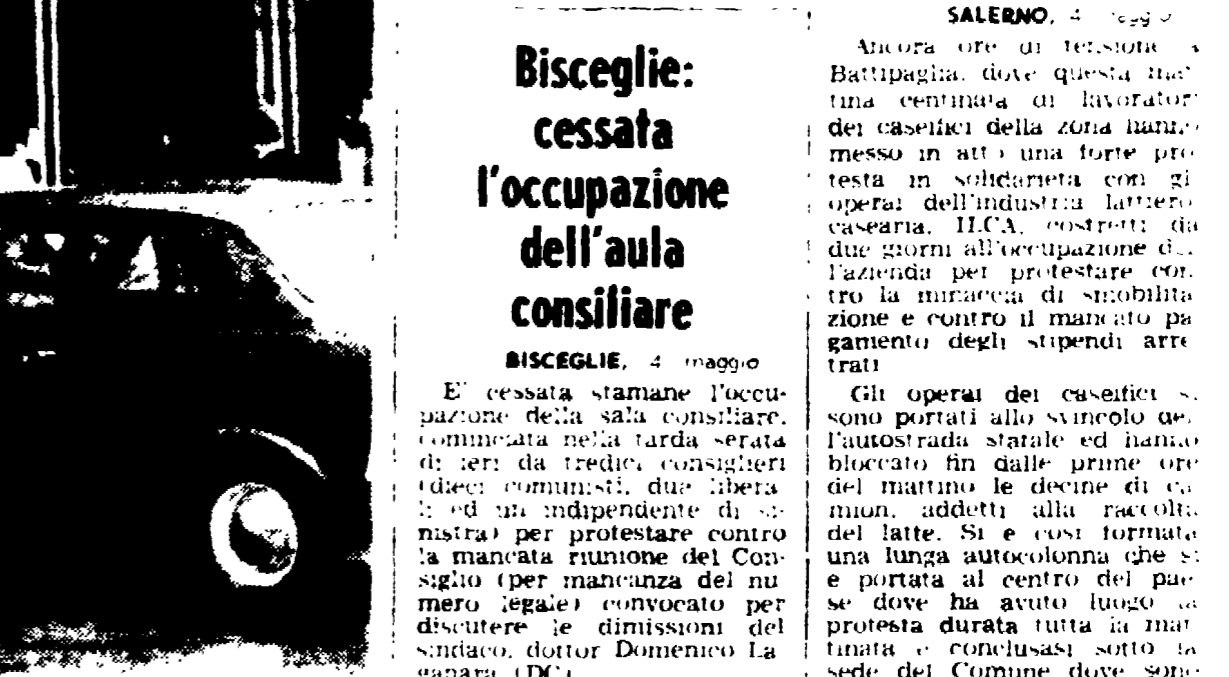
SALERNO, 4 maggio

Bloccati i camion di raccolta del latte - Bidoni rovesciati davanti al Comune - Mestri compagni deputati sul posto - Forte movimento di lotta nel Salernitano - Il governo sordo alle richieste delle masse