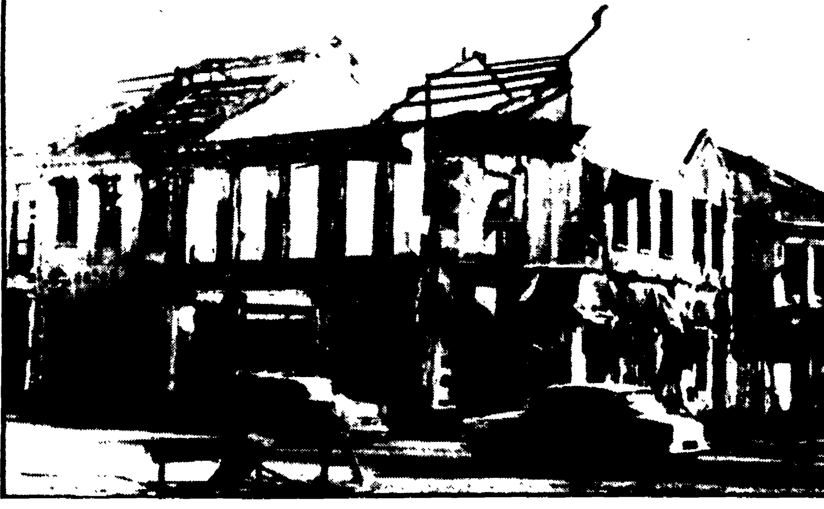
KUALA LUMPUR — Nonostante il coprifuoco permanente, continuano per le strade della capitale malese i sanguinosi scontri. Nella foto: un aspetto di un quartiere periferico di Kuala Lumpur dopo una delle tante battaglie di strada.

Continuano gli scontri nelle vie della città - Il governo minaccia la legge marziale per far fronte allo spostamento a sinistra registratosi fra la popolazione cinese nelle recenti elezioni