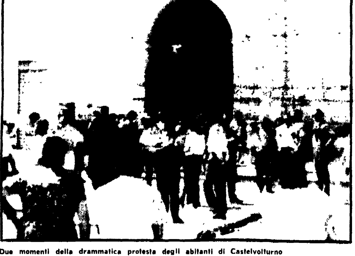
Due momenti della drammatica protesta degli abitanti di Castelvoturno