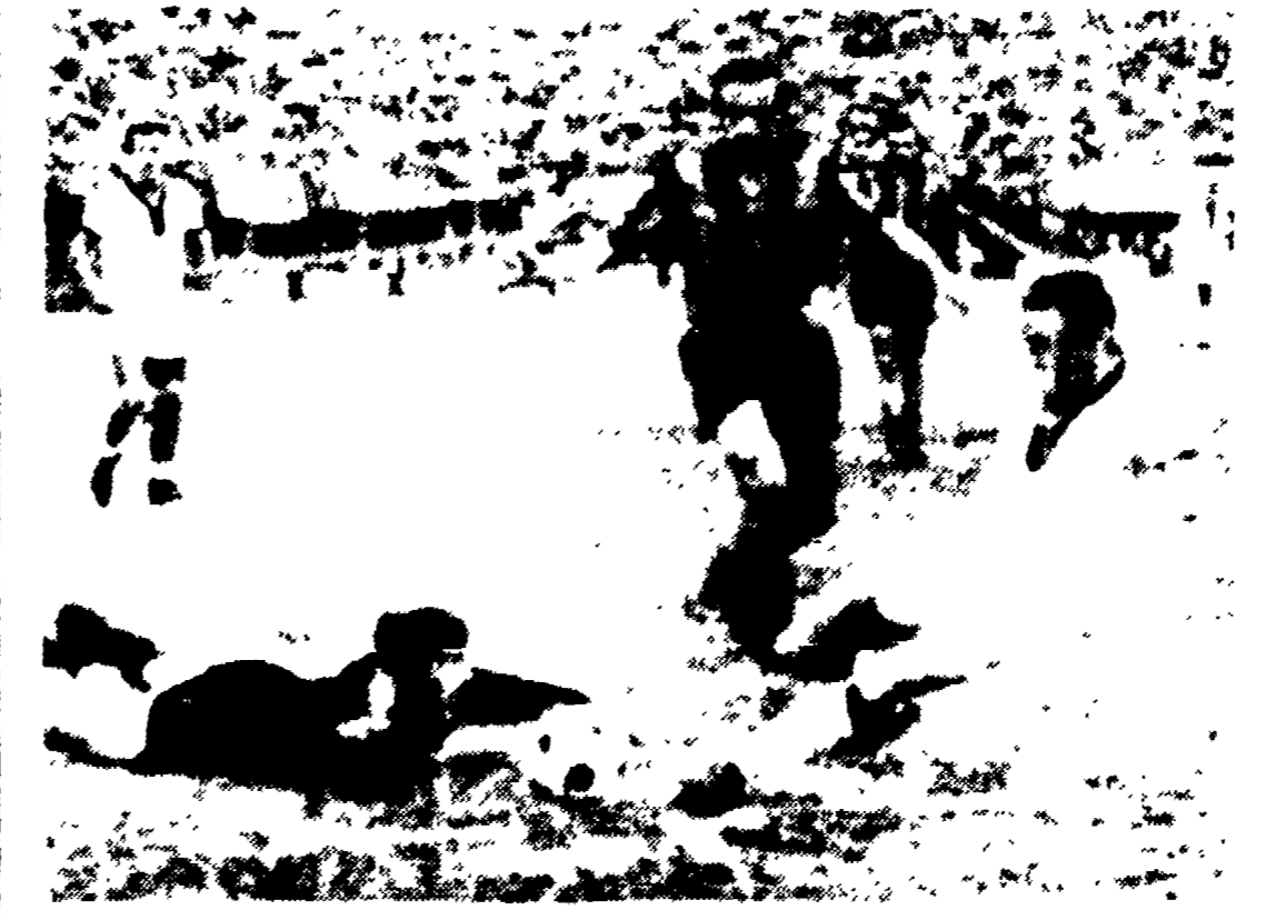
ATALANTA-CAGLIARI - Riva realizza la prima rete dei sardi e rafforza la sua posizione di «capocannoniere» del torneo, nel corso del quale ha segnato venti volte.

La Fiorentina ha sostituito il suo nuovo scaglieri, l'atletico di Varese, mentre il Napoli ha speso il suo nuovo limite di spesa, che ammonta a 100 milioni. La Juve invece è rimasta invariata, con un bilancio di 100 milioni. La Fiorentina ha sostituito il suo nuovo scaglieri, l'atletico di Varese, mentre il Napoli ha speso il suo nuovo limite di spesa, che ammonta a 100 milioni. La Juve invece è rimasta invariata, con un bilancio di 100 milioni.