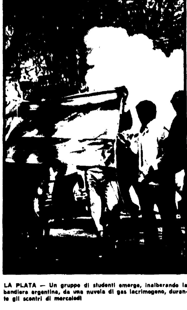
LA PLATA - Un gruppo di studenti emerge, inabberando la bandiera argentina, da una nuvola di gas lacrimogeno, durante gli scontri di mercoledì

BUENOS AIRES 24. Una situazione esplosiva si è creata in Argentina a seguito del rito e Santa Fe e altri centri delle repressioni poliziesche dei giorni scorsi, nel corso del quali tre studenti hanno perduto la vita.