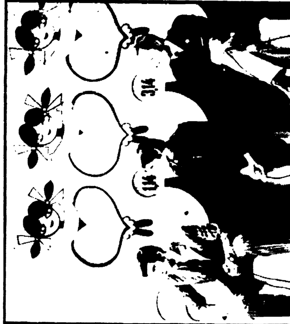
Fra le trasmissioni che hanno raccolto i giudizi più negativi sono il « Telegiornale » (foto a sinistra: lo studio delle 13.30) e « Settevoci » (foto a destra: un gruppo di concorrenti ai pulsanti). Il primo è accusato di disinformazione, il secondo di essere l'esemplare tipico delle « troppe canzoni » radio-televisive

Iniziamo il bilancio definitivo del referendum sulla Rai-Tv