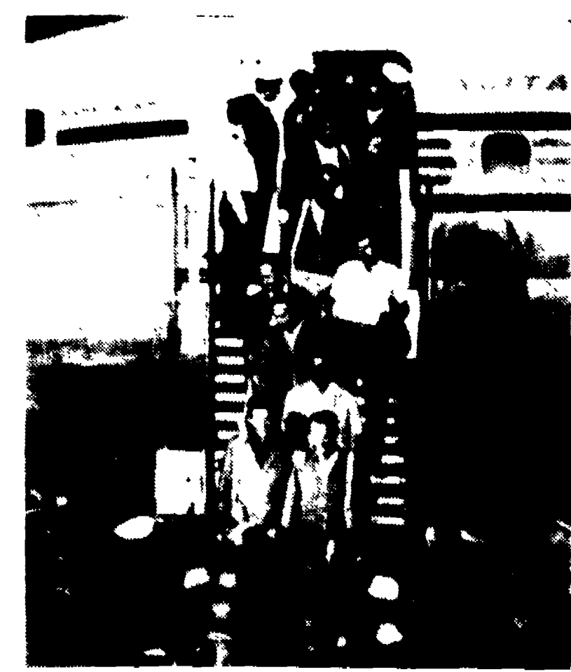
ROMA — I tecnici dell'ENI mentre scendono dall'aereo che li ha riportati...