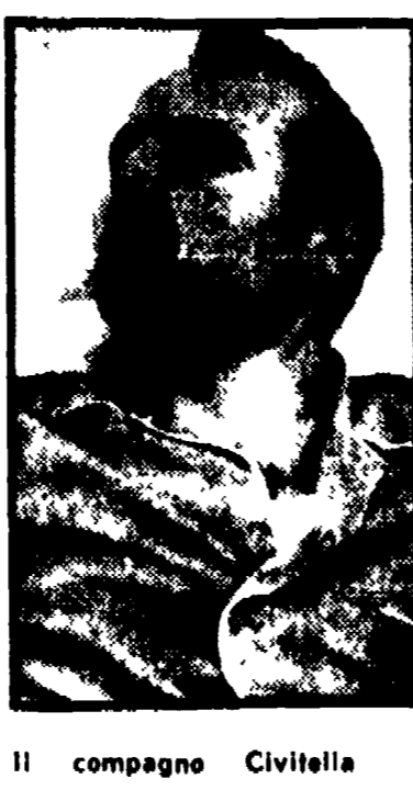
Il compagno Civitella

La soluzione della crisi e le aspettative dei lavoratori e della cittadinanza saranno anche argomento di una conferenza stampa, indetta per questa mattina dai gruppi consiliari comunisti.