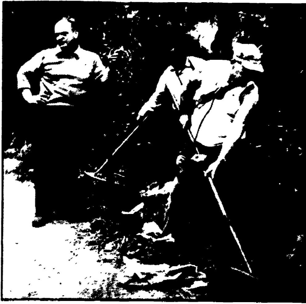
Tecnici dell'artiglieria cercano l'arma del delitto

Li ha richiesti il PM: «Approfittò della sua carica per truffare lo Stato»