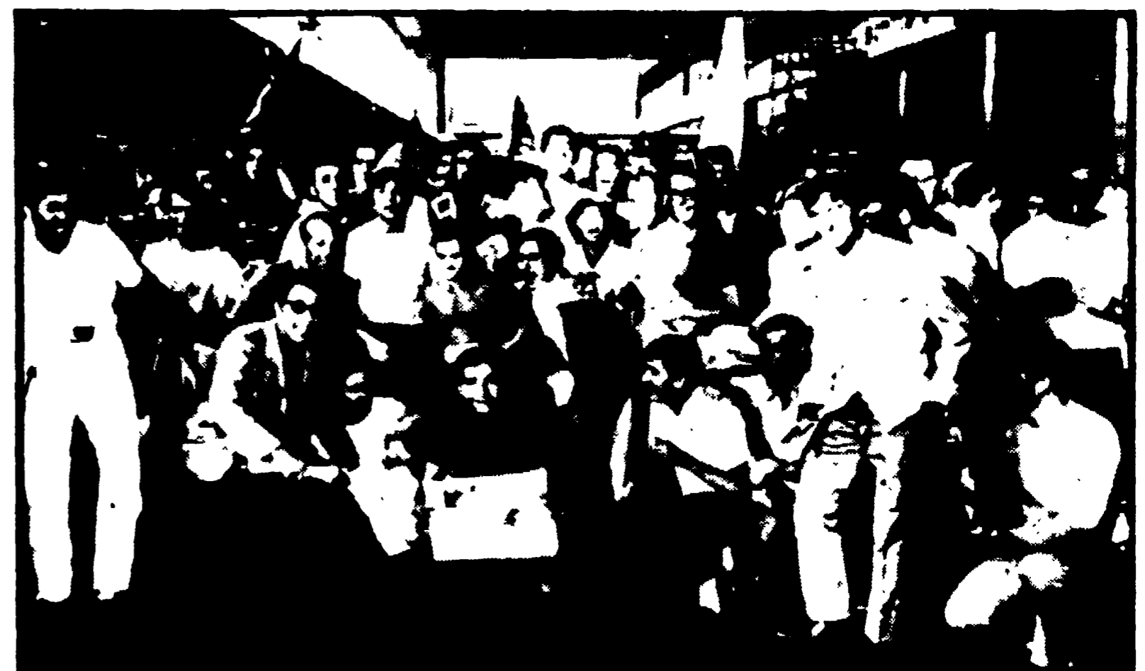
Continuano di tifosi romanisti si sono recati ieri mattina alla stazione Termini per aspettare i giocatori della Roma: ma l'attesa è stata vana perché a causa dello sciopero dei ferrovieri, i giocatori sono tornati in pullman