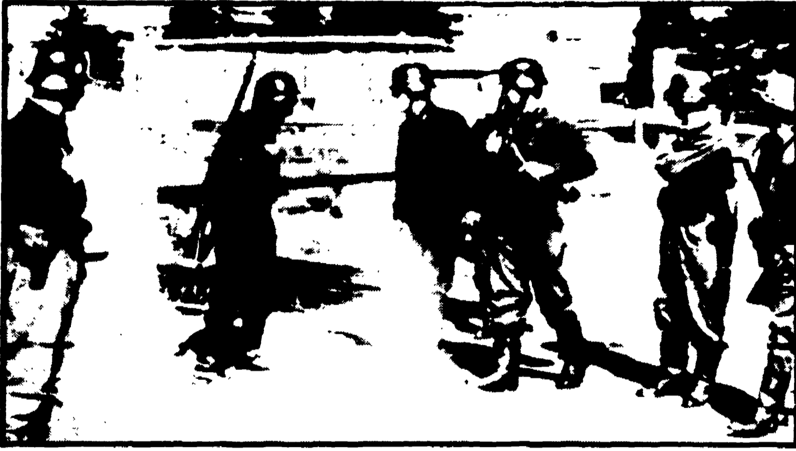
CORDOBA - In assetto di guerra, soldati argentini pattugliano le strade adiacenti lo stabilimento FIAT-Concord, dove è in atto una dura lotta operaia.

Il regime specula sull'assassinio di Vandor per dividere le due centrali sindacali - Due settimane fa l'ucciso si era incontrato a Madrid con l'ex-dittatore Peron - Rockefeller vola in visita nell'isola di Haiti per incontrare Duvalier - E' partito protetto dai poliziotti