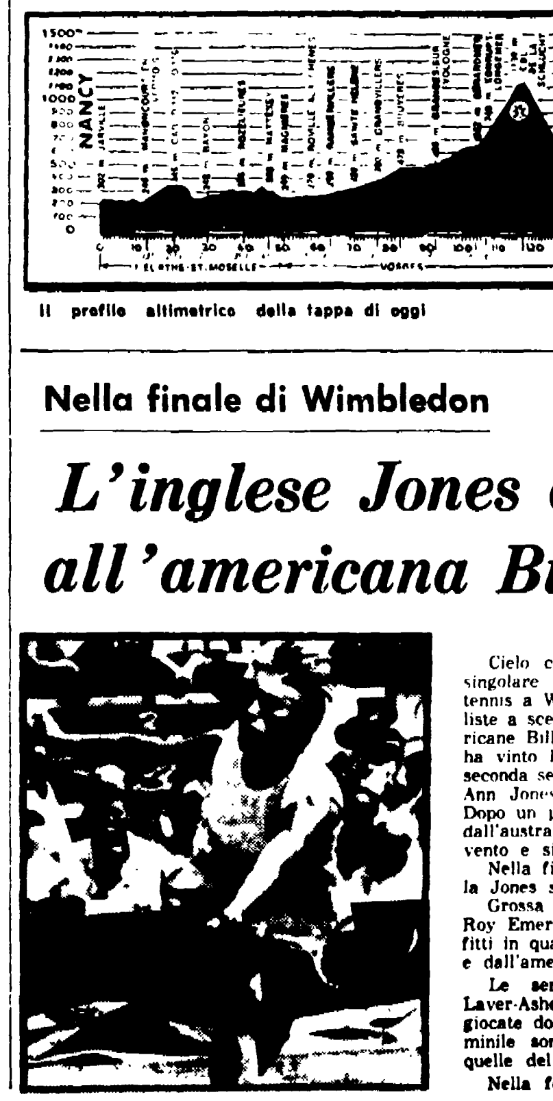
WIMBLEDON, 2. Nella finale di Wimbledon L'inglese Jones di fronte all'americana Billie King