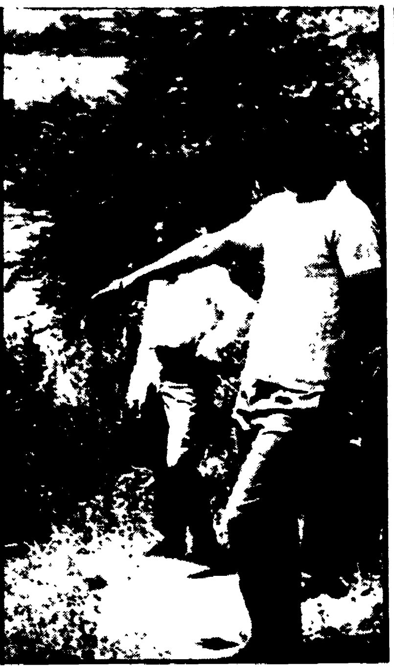
Alcuni ragazzi indicano il punto dove è stata trovata la testa dell'assassino.

Un imbroglione maledetto per gli investigatori partiti oltretutto con l'handicap di aver pensato per un momento che si trattava di una disgrazia o di un suicidio e che in pratica si trovano ora a dover cominciare da zero. E adesso gli interrogatori sono come Chi è l'uomo? Dove è finito il corpo? Chi è l'assassino? Per ora non c'è alcun elemento, si possono soltanto avanzare delle ipotesi su come si è svolto l'omicidio.