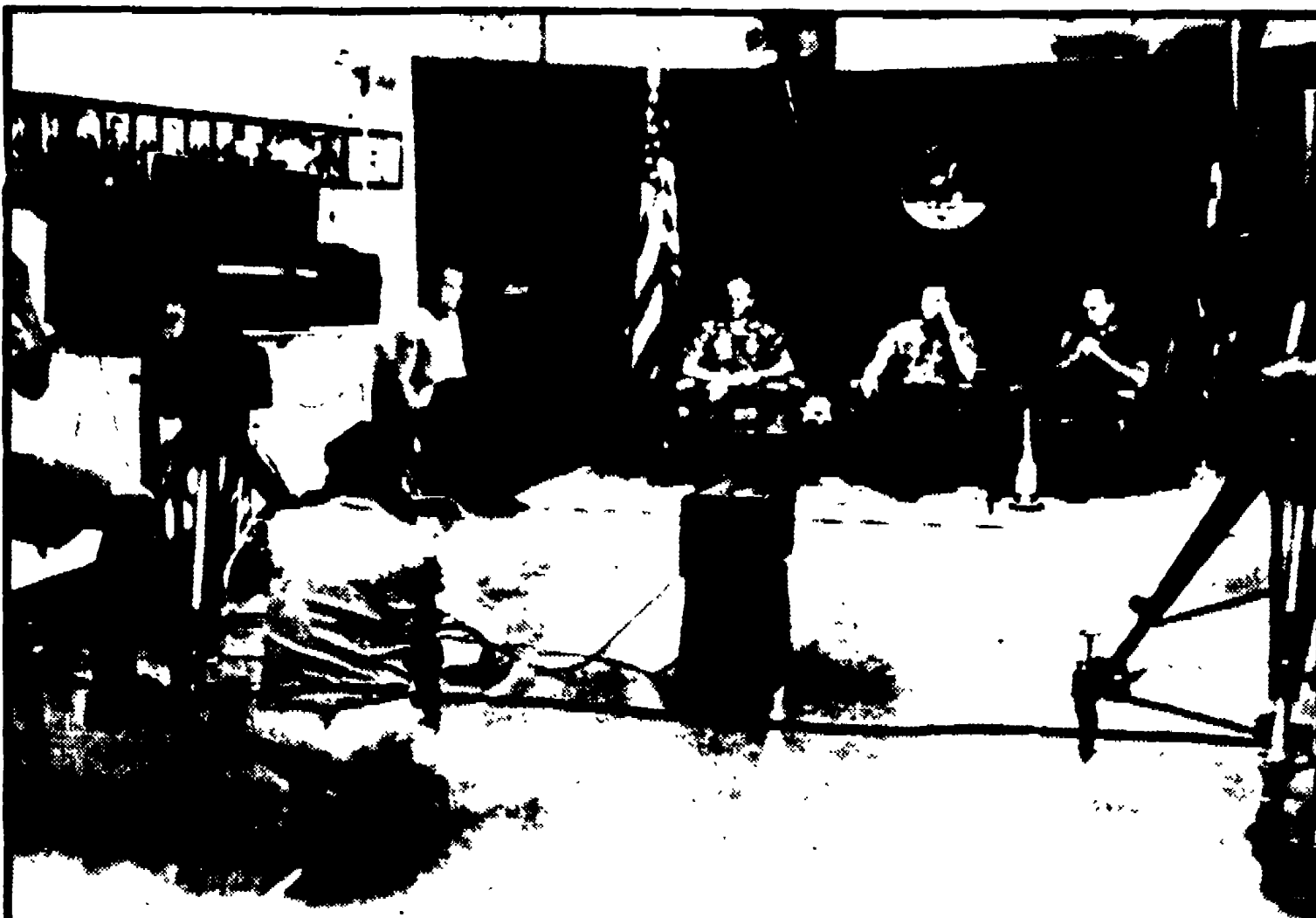
Oggi alle 15,32 scocca l'ora della grande impresa per la Luna. Da Capo Kennedy si alza il « Saturno 5 » con a bordo gli astronauti Armstrong, Collins e Aldrin.

Contro l'ipotesi di un governo a due con il Partito socialista